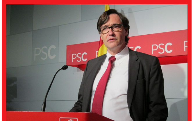
El secretario de Organización del PSC, Salvador Illa

El Secretari d'Organització del PSC, Salvador Illa, ha afirmat en relació a les informacions sobre que la Fiscalia està investigant les empreses implicades en una eventual secessió de Catalunya, que "hem dit sempre que no hi ha cap futur fora de la llei, i que tot allò il·legal està condemnat a no portar-nos enlloc. Valorem la investigació dins la normalitat de la seva tasca". En roda de premsa a la seu central del PSC després de la reunió del