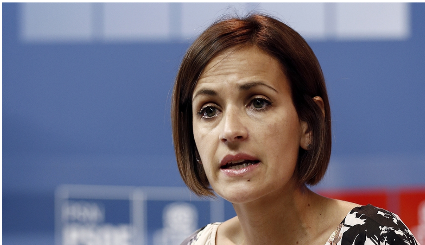
La secretaria general del PSN, María Chivite

NAVARRA / El PSN-PSOE pide al Gobierno de Navarra que ponga el esfuerzo en cuestiones estratégicas y prioritarias como agilizar el Tren de Altas Prestaciones y el Canal de Navarra, el suministro energético o, ya en otro ámbito, en rectificar y construir esta legislatura el instituto para la zona de Cabanillas, Fustiñana y Ribaforada, ya que el Consejero dice ahora que no se hará. Estos son los temas del día a día que han de ocupar al Gobierno porque son los que generan oportunidades, futuro, y favorecen la cohesión social y territorial y la igualdad de oportunidades. Así lo señala la portavoz parlamentaria, María Chivite. Estas cuestiones las han abordado los socialistas en la sesión de la Mesa y Junta de Portavoces del Parlamento. Pero también otras como una declaración institucional del PSN-PSOE de solidaridad con el pueblo colombiano, que está viviendo una tragedia por las inundaciones, y otra también aprobada por unanimidad de condena de la agresión homófoba ocurrida este fin de semana en Pamplona. LEER MÁS ►