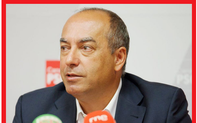
El senador del PSOE por la Comunidad Autónoma de Canarias, Julio Cruz

El senador del PSOE por la Comunidad Autónoma de Canarias, Julio Cruz, ha apoyado la propuesta de Reglamento del Parlamento Europeo y del Consejo sobre el respeto de la vida privada y la protección de los datos personales en el sector de las comunicaciones electrónicas que, entre otras cuestiones, prohíbe las comunicaciones electrónicas no solicitadas por cualquier medio, por ejemplo, mediante correos