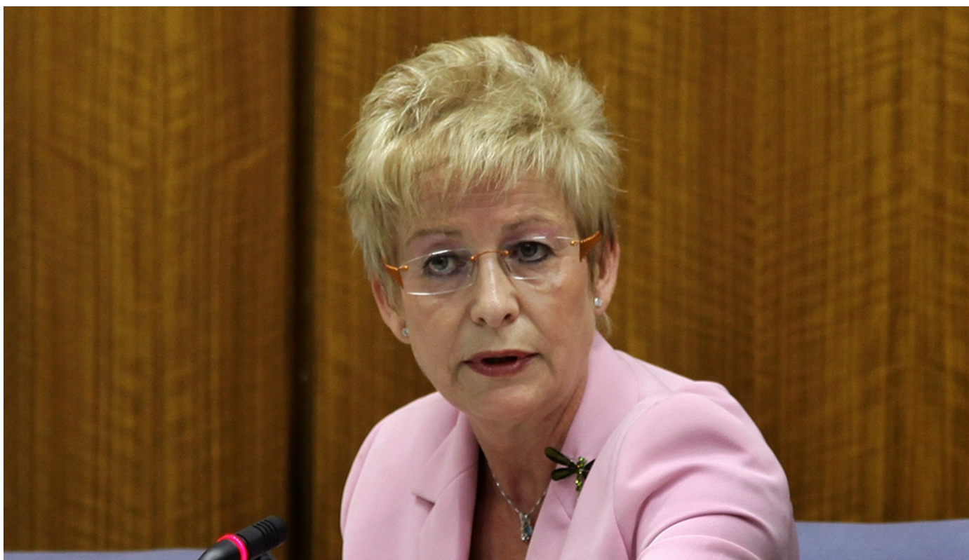
La portavoz del PSOE en Agricultura y senadora por Andalucía, Elena Víboras

MADRID / El Grupo Socialista ha advertido de la complejidad administrativa y burocrática, así como de la falta de coordinación entre las distintas administraciones, y ha hecho un llamamiento al Ejecutivo a favor de que se acelere, reconozca y simplifique el registro de los procesos de productos fitosanitarios con el objetivo de ayudar a la economía de nuestro país y a mejorar considerablemente la competitividad de todos nuestros agricultores. Así se ha pronunciado la portavoz del PSOE en Agricultura y senadora por la Comunidad Autónoma de Andalucía, Elena Víboras, en la Comisión de Agricultura, Pesca y Alimentación, ante la que ha intervenido para fijar la posición de su Grupo Parlamentario en relación a una moción de ERC que exigía al Gobierno agilizar los plazos en el proceso de registro... LEER MÁS ►